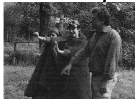
La Troupe du Favier Théâtre répète dans le parc animalier de l'Emprunt

Le soir, le "Favier Théâtre" et les acteurs de l'Atelier-Théâtre de l'ALC présentent une adaptation du célèbre "Roman de Renart" au parc animalier de l'Emprunt.